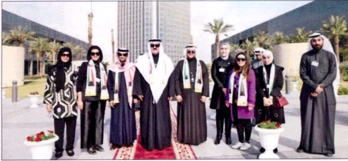
• علي المصنف مع قيادات التطبيقي

والجميع بخير وعافية. مقدما الشكر لجميع من ساهم في إقامة واتجاح هذه الاحتفالية. وفي كلمة مماثلة تقدم نواب المدير العام بالتهنئة للشعب الكويتي كافة ولمنتسبي الهيئة بمناسبة ذكرى الأعياد الوطنية. مؤكداً أن هذه الاحتفالات هي دلالة على الحب والوفاء للوطن. وأن الشعب الكويتي تميز بروح الوحدة الوطنية التي من خلالها استطاع تحطيم كل الإزمات. موضحين أن حب الكويت يتجسد من خلال الإخلاص والتفاني في العمل. متعينين أن يديم الله الأمن والأمان على البلاد تحت ظل صاحب السمو أمير البلاد.